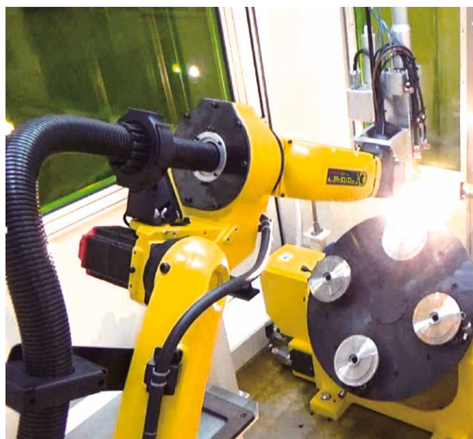
ファイバレーザ溶接