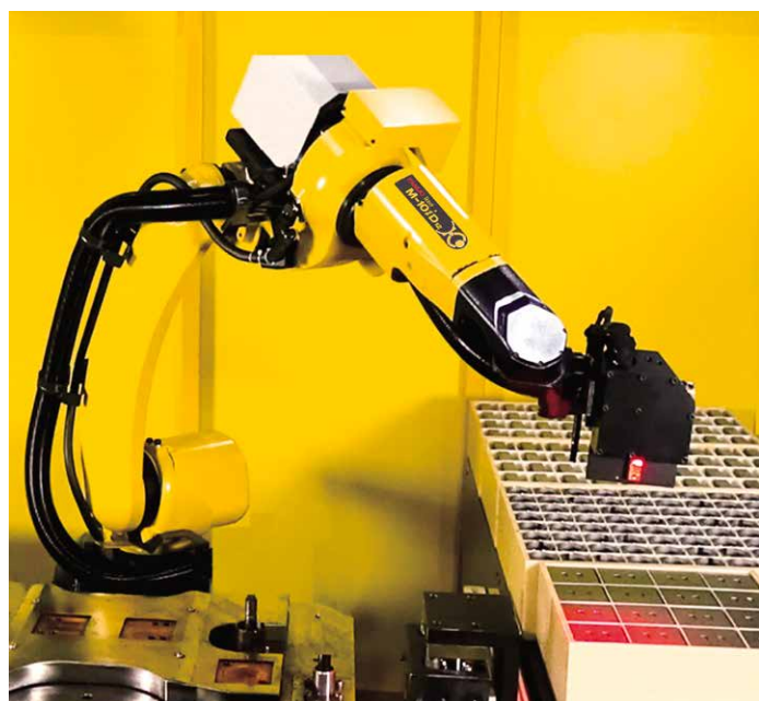
板金部品のハンドリング